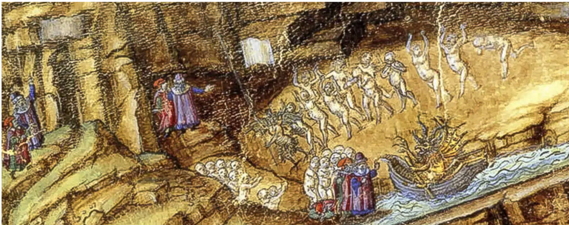
Sandro Boticelli. Fragmento de los infiernos de Dante

Conocía bien el II Congreso Nacional de la CNT, celebrado entre el 10 y el 18 de diciembre de 1919, porque había asistido. Esto y su continuada militancia le permiten hacer un balance del mismo pero desde el año 1923. Se ha producido un incremento de la fuerza sindical pero más bien exógeno y motivado por el impacto de la revolución rusa que asustó a la burguesía; y las subidas salariales, al calor del incremento de la producción en España, gracias a su neutralidad durante la primera guerra mundial. Ahora, en 1923, en plena recesión, la organización debe contar exclusivamente con sus propios medios y eso, a su parecer, la hará verdaderamente más fuerte.