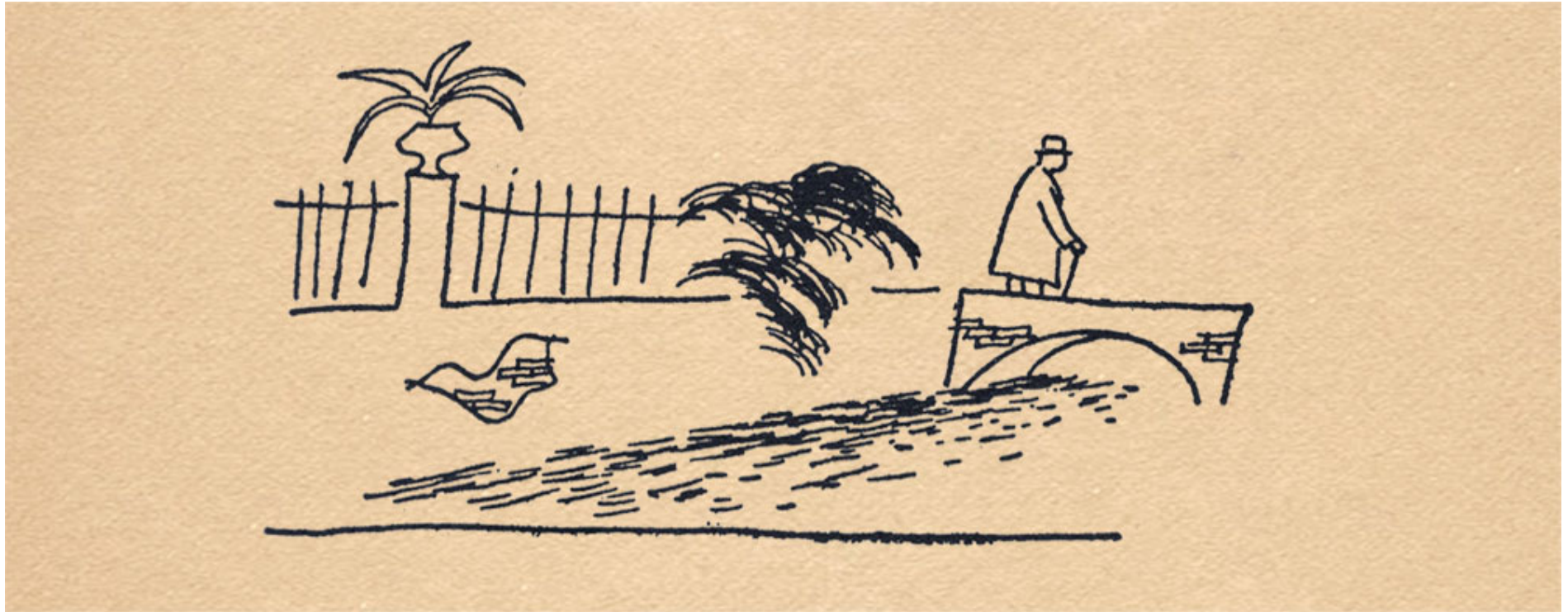
Ramón Gaya, ilustración en el nº 2 de Hora de España con Antonio Machado cruzando el puente sobre un acequia de Montcada. Valencia 1937

En esta entrada, segunda dedicada a la figura de Antonio Machado, incluimos diferentes poemas homenajeando al escritor sevillano que fue muy querido por el pueblo español, no así por los sublevados contra la legítima II República española y que pretendieron borrar a personajes como Machado de la memoria histórica. No lo consiguieron a pesar de la dictadura de plomo que duró décadas de espantosa represión policial. Tampoco el respeto que su figura tuvo en pueblos de muchos países, sobre todo en los latinoamericanos.