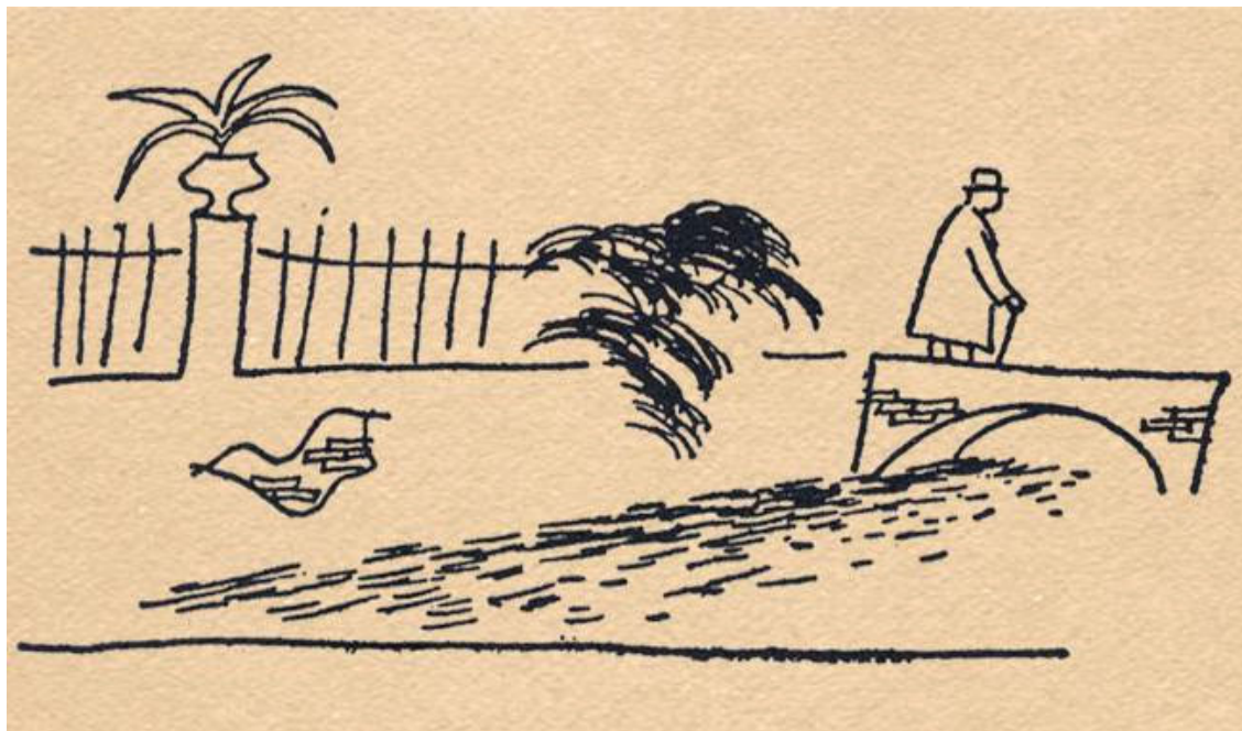
Ilustración de Ramón Gaya en el nº 2 de Hora De España con la figura de Antonio Machado cruzando el puente sobre un acequia Montcada al paso por Rocafort, Valencia 1937; dibujo que encabeza el escrito de Antonio Machado “ Sigue hablando Mairena a sus alumnos ”

El poema describe los recuerdos de un sueño infantil de una noche clara de luna llena y fiesta en la que un hada joven llevó al niño a una alegre fiesta en la plaza donde el amor se tejía en danzas bajo las luminarias, y el hada besó la frente del niño al despedirse esa noche mágica llena de aromas de rosales y amores nacientes.