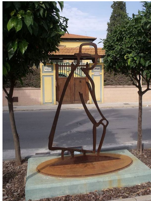
Escultura de línea basada en dibujo de Ramón Gaya Hora de España nº 2 colocada frente a la fachada de Villa Amparo de Rocafort.

«Junto a la escalera, desde se dominan los limoneros, las flores del jardín, los campos de Rocafort, nos despedimos de el. Allí, junto a la casa, el gran poeta español, llenos de brillo los ojos -brillo de esperanza en la juventud, de fe en ella-, comienza a subir la escalera. Sus palabras apasionadas, repletas de emoción, vibran en nosotros.» □