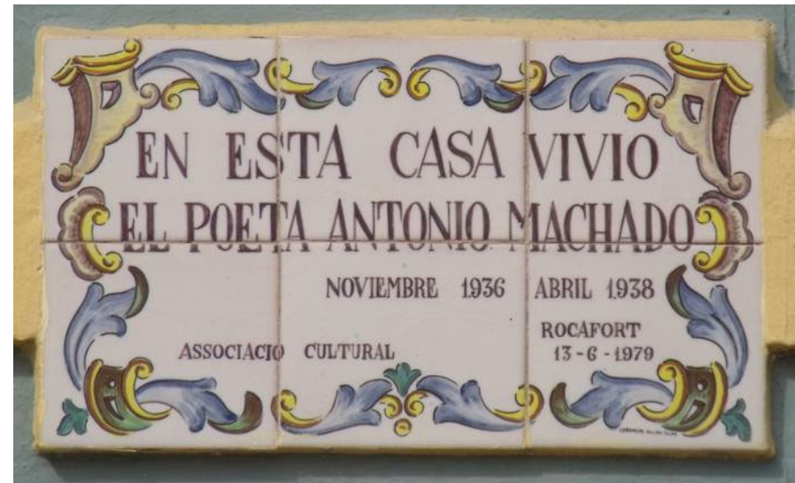
Placa en recuerdo de los Machado junto a la puerta de Villa Amparo y colocada por la Asociación Cultural de Rocafort . 13 de junio de 1979