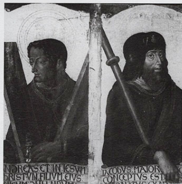
San Andrés y Santiago el Mayor. AHPHU.