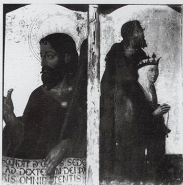
Santiago el Menor y la reina doña Sancha con santo protector. AHPZ. Fondo Mora Insa.