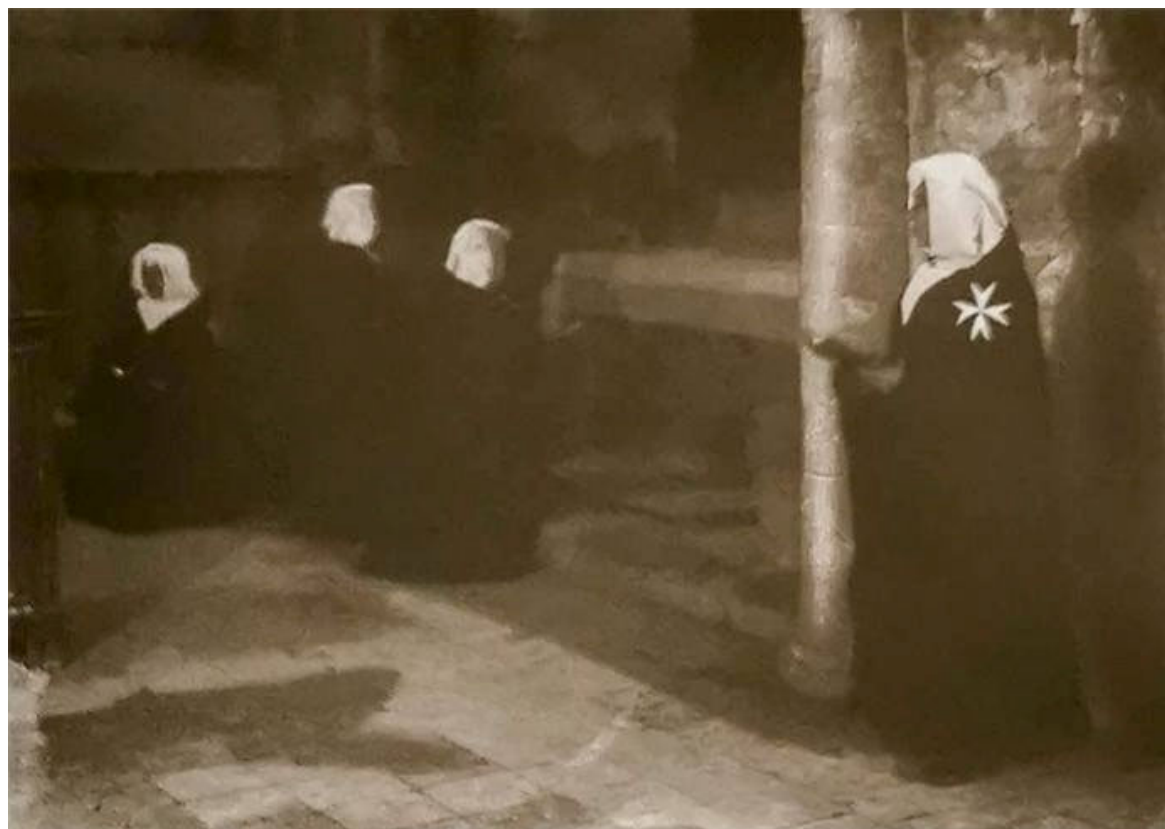
Monjas orando. Monasterio Sijena .Foto, en blanco y negro.

Afortunadamente cuatro de las tablas procedentes del antiguo retablo mayor renacentista, desmontado en el siglo XVIII, habían formado parte de la dotación fundacional del Museo de Huesca que cincuenta años antes había impulsado con un destacado protagonismo el erudito, bibliófilo y coleccionista oscense, Valentín Carderera, quien donó parte de su colección particular para el arranque de la institución, entre las que se encontraban las cuatro tablas mencionadas. Desde entonces estas obras han estado vinculadas de forma continua a esa institución durante sus 150 años de andadura, convirtiéndose en unas de sus conjuntos artísticos más relevantes.