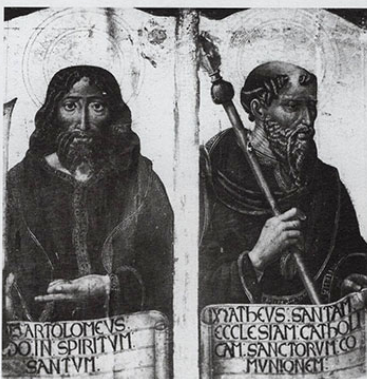
San Bartolomé y San Mateo. AHPHU.