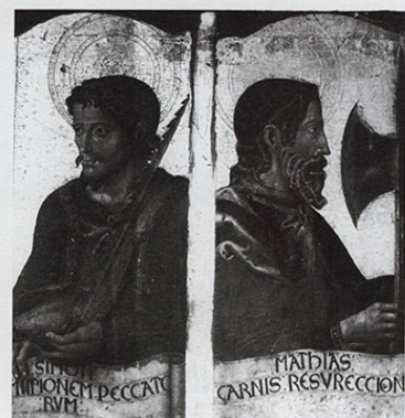
San Simón y San Matías.