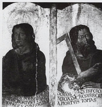
San Juan y Santo Tomás.