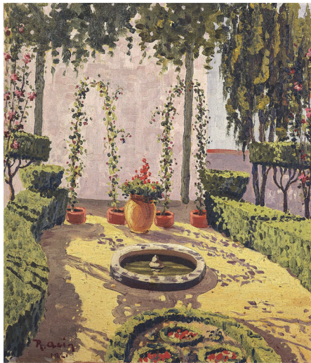
231-Jardín de Anzánigo (Huesca)

Muchacha de medio cuerpo y de frente, con vestido rosa de amplio escote redondo con cuello blanco, ante un fondo de zarcillos de flores que siluetean su figura.