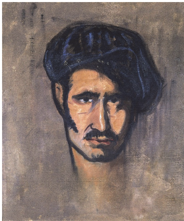
Autorretrato con boina. Óleo sobre lienzo, 1920-1925