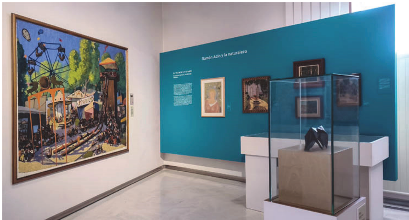
Vista de la sala con las seis obras objeto de la muestra. en la pared izda (y fija en la sala), La Feria , y en el paño dcho las restantes

Algunas de sus obras forman además parte de la Guía Botánica del Museo de Huesca que se ofrece como parte de la colección editorial de la institución oscense. De la mano de Eduardo Barba, tres obras de Ramón Acín son analizadas para buscar bellos detalles botánicos. Nos referimos a La Feria ; Muchacha y Jardín de Anzánigo que podemos contemplar en esta pequeña muestra.