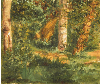
209-Rincón del bosque