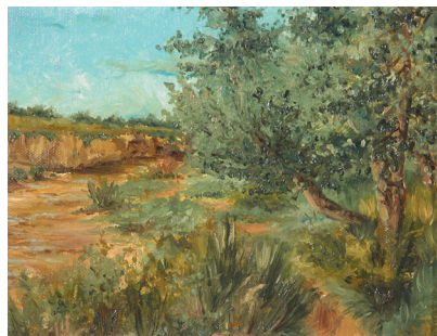
208-Árboles y cauce de un río