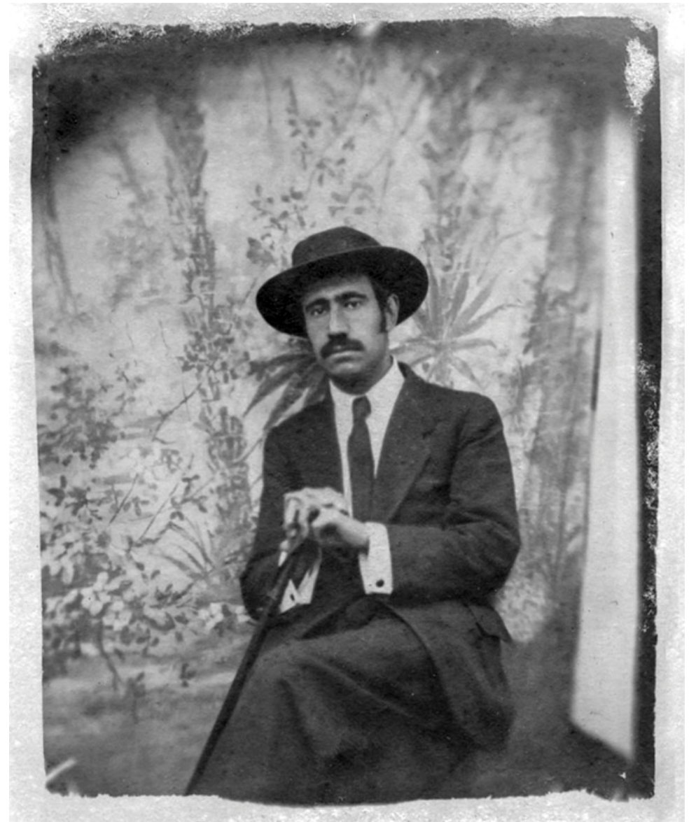
Ramón Acín hacia 1916