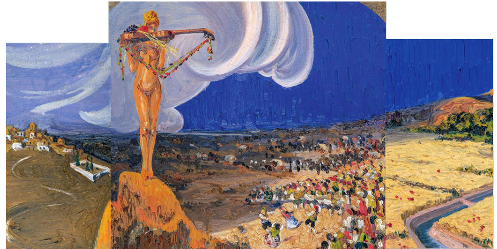
Alegoría del baile. Acín 1915. Tríptico alegórico a los riegos.

¿Qué valen nuestras lágrimas junto a las de los ríos que nacen de unos copos de nieve, albos, albos y puros como Espíritus Santos que fueron posándose en la cima de unos picachos altos? □