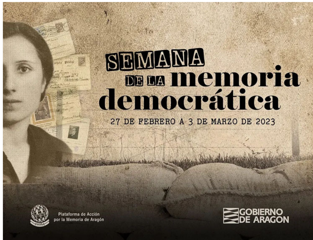
Cartel anunciador de la Semana de la memoria democrática , de 2023

Partido en dos mitades prácticamente idénticas durante la guerra civil, Aragón fue uno de los escenarios principales del conflicto, un auténtico microcosmos de todas las situaciones que pudieron llegar a producirse. Es una de las razones por las cuales su Ley de Memoria estaba especialmente bien construida y atendía a todas las sensibilidades. A modo de ejemplo, se indicaba que su objetivo era «facilitar la recuperación de la memoria individual y colectiva de las víctimas del golpe de Estado de 1936, de la guerra civil y de la dictadura franquista», pero no deja de señalarse que dicho empeño «ha de poder ser compatible [...] con el reconocimiento de las violaciones de los derechos humanos que se dieron en Aragón en la zona republicana», lo que incluía la «exhumación e identificación por parte de descendientes de las personas asesinadas» . 1