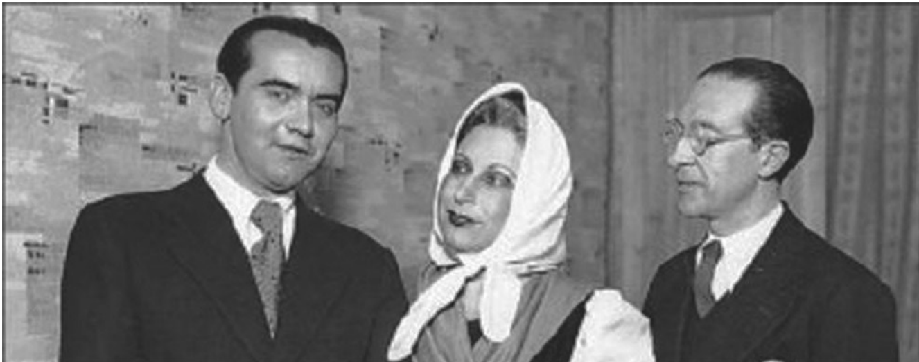
Federico García Lorca, Margarita Xirgu y Cipriano Rivas-Cherif

Ya estoy en trance de hacer la colección, tal y como la planeamos: en tres partes, a saber: a) “La madre patria.” Con los poetas españoles más culpables. b) “América virgen y mártir.” Y c) “Las faldas del Parnaso,” en que se incluye las poetisas y los curas.□