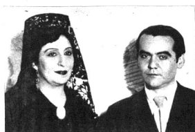
García Lorca, con Lola Membrives, admirable intérprete de «Bodas de sangre»

Los bastidores de la guerra. Cómo durante la lucha mundial se crearon y lanzaron noticias falsas para desorientar al enemigo