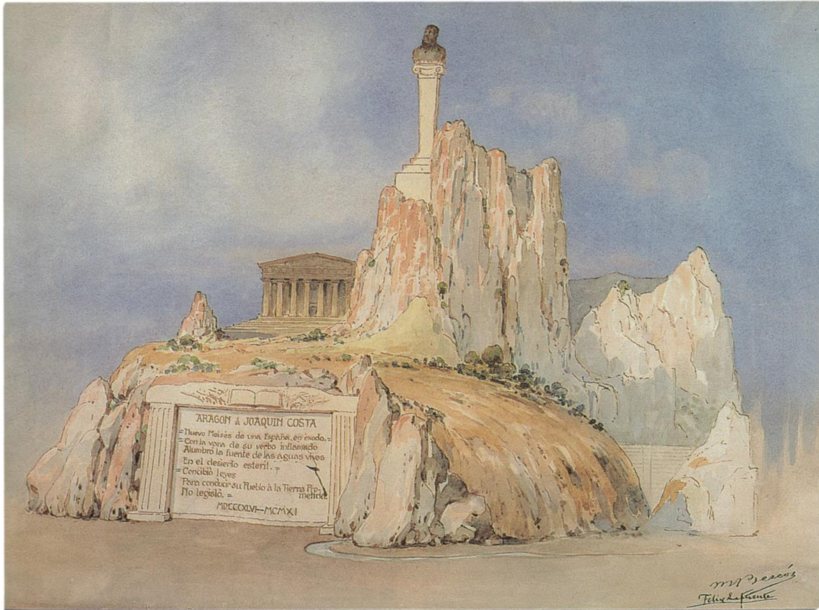
Boceto definitivo de Manuel Bescós y Félix Lafuente, 1911