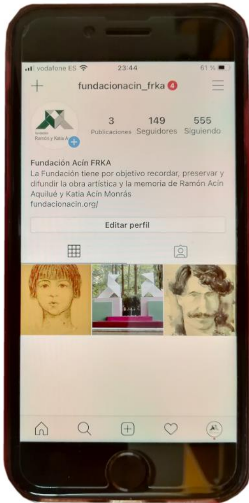
Pantalla de bienvenida de FRKA a los pocos días de la publicación