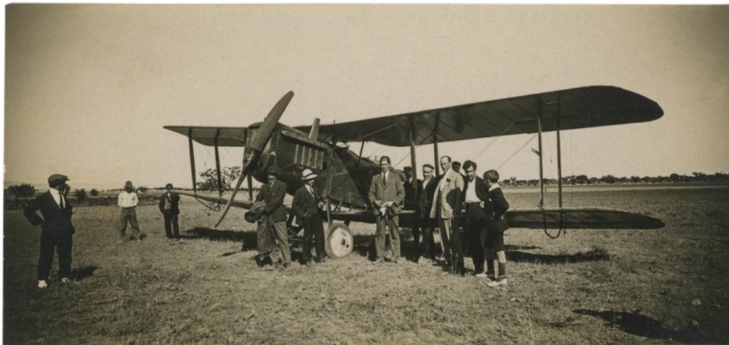
Imagen tomada por Albasini el 12 de agosto de 1921 tras el aterrizaje del aeroplano Bristol pilotado por el inglés Milner en el oscense campo de Cuarte para realizar una exhibición aérea con motivo de las fiestas de San Lorenzo. En la foto aparece Acín a la derecha y el aviador en el centro con la comisión de festejos