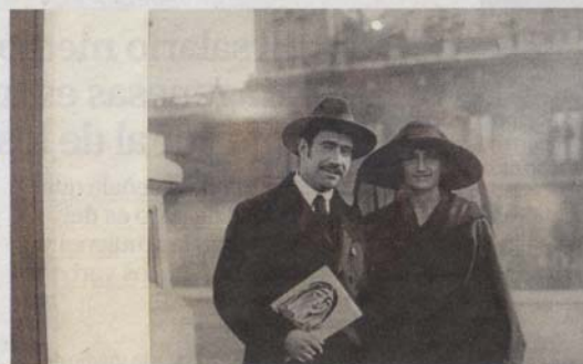
El matrimonio, en una de las fotografías que exhibe esta muestra.

madre, le contaba que tenía los pies en la tierra.