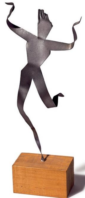
Ramón Acín Bailarina , 1928 Chapa de aluminio

cuidada depuración formal, su arte se «desterritorializa» para confundirse con la vida y reflejar la esencia, el «sol de la Belleza», la Luz.